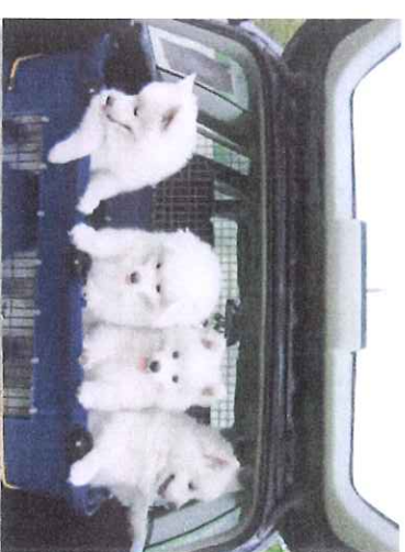
A-Wurf My Smiling Suncoat Alisza-Pearl, Aragon, Anakin-Aico, Aramis

Unsere Welpen werden liebevoll in Haus (direkt im Wohnzimmer), Terrasse und Garten aufgezogen.